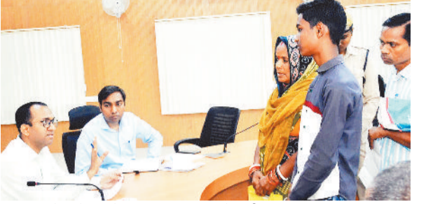
जनदर्शन में कलेक्टर के समक्ष फरियाद करते ग्रामीण।