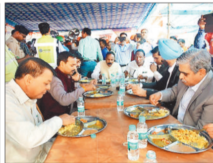
दाल भात केंद्र में भोजन करते मंत्री एवं अन्य।