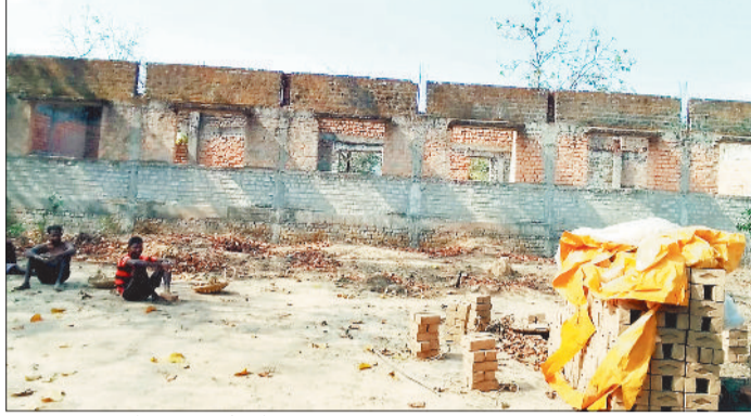
नकिया पंचायत के ग्राम खम्मोन में आधा अधूरा बना स्कूल भवन।

जिले के जनजाति बसाहट क्षेत्रों के विकास के लिए तमाम तरह के फंड खर्च होने के बावजूद शिक्षा और स्वास्थ्य की