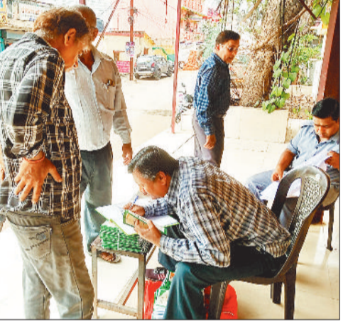
नया राशन कार्ड जिसमें नहीं लगी है सील।