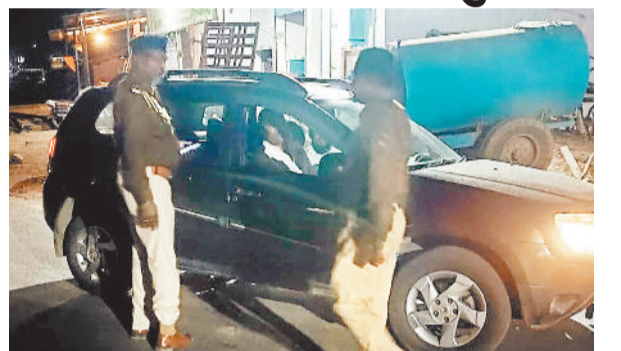
कार्रवाई करती पुलिस।