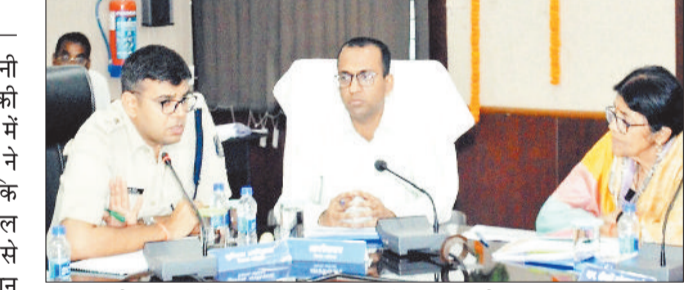
बैठक लेती सांसद ज्योत्सना महंत, उपस्थित कलेक्टर व एसपी।

जिला विकास समन्वय एवं निगरानी समिति (दिशा) की बैठक सांसद की अध्यक्षता में जिला पंचायत सभाकक्ष में आयोजित की गई। बैठक में सांसद ने अधिकारियों को निर्देशित किया कि जिले में शिक्षा, स्वास्थ्य एवं जल जीवन मिशन के कार्य प्राथमिकता से पूर्ण करें। जिले में युवा एवं ऊर्जावान अधिकारियों को टीम मौजूद है, जिला प्रशासन द्वारा शासन की योजनाओं का प्रभावी क्रियान्वयन करते हुए योजनाओं से हितग्राहियों को लाभान्वित किया जाए। सांसद श्रीमती ज्योत्सना महंत ने दूरस्थ इलाकों में पोस्टमार्टम (शव परीक्षण) केंद्र, मच्छुरी, एंबुलेंस का संचालन करने, स्वास्थ्य, विद्युत और शिक्षा जैसी सुविधाओं को और बेहतर