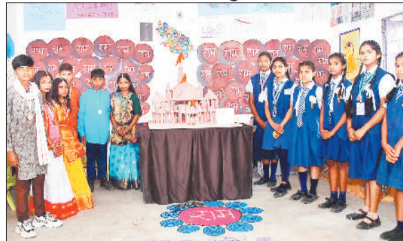
प्रदर्शनी के दौरान उपस्थित छात्र छात्राएं।